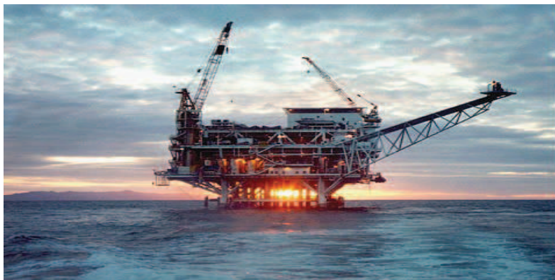
IMAGEN DEL PROYECTO