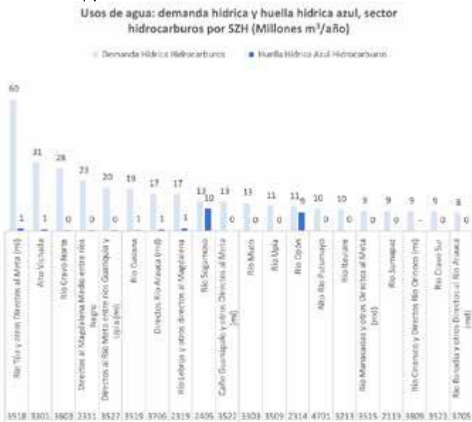
Figura. Usos de agua (demanda hídrica y huella hídrica azul), sector hidrocarburos por SZH

En la Figura a continuación se observa una visualización decreciente de las veinte SZH con mayor valor del uso del agua (demanda hídrica y huella hídrica azul) para el sector hidrocarburos.