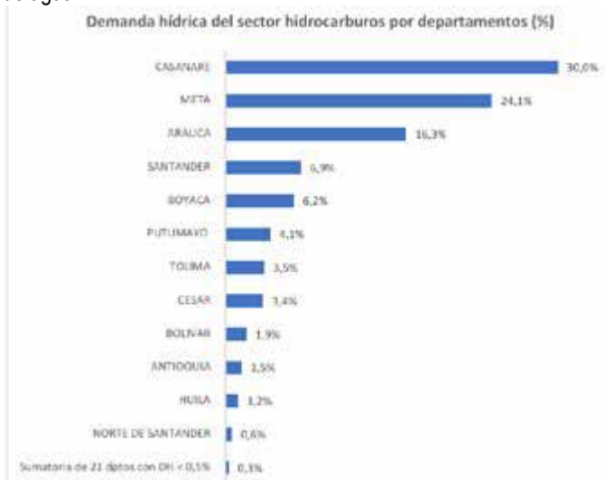
Figura. Demanda hídrica del sector hidrocarburos por departamento

En la Figura próxima se presenta la demanda hídrica del sector hidrocarburos por departamentos, en la que se evidencian aquellos departamentos con mayor uso de agua.