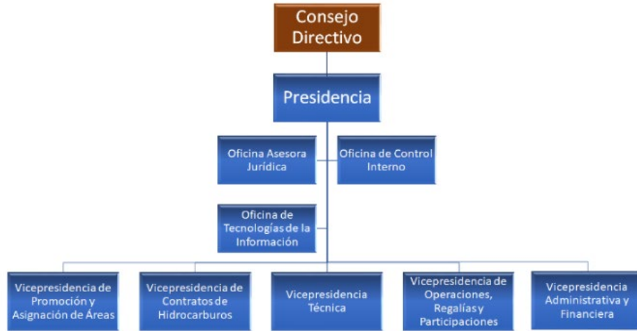
Imagen Organigrama ANH

ANH cuenta con veinte (20) procesos como se observa en la imagen más abajo, los cuales dan cubrimiento a la estrategia, la misionalidad, el apoyo y la evaluación: