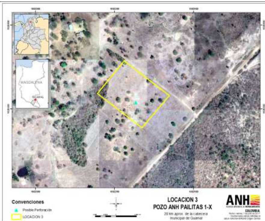
Figura 4. Posible ubicación 3 del punto 3, donde es posible desarrollar el pozo en la cuenca VIM