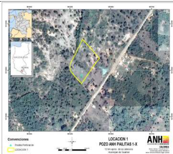
Figura 2. Posible ubicación 1 del punto 1, donde es posible desarrollar el pozo en la cuenca VIM