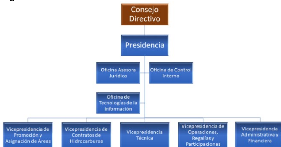
Figura 1. Organigrama ANH